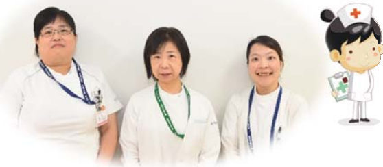
緩和ケアセンター専従看護師

“緩和ケア”とは、病気と闘っている患者さんと、そのご家族を対象とした積極的なケアです。“緩和ケア”という言葉のひびきは、“終末期の方が受けるケア”と、とらえる方も少なくないかと思えます。しかし、“緩和ケア”とは、病期に関係なく、痛みをはじめとする、病気にとまなうさまざまな症状の緩和をめざすケアのことです。その中には、体の症状だけではなく、心のケアや社会・経済的な問題へのケア、退院後の療養生活に向けた支援、希望を支えるためのケアなどが含まれます。緩和ケアチームの紹介を希望される方は、主治医・看護師にご相談下さい。